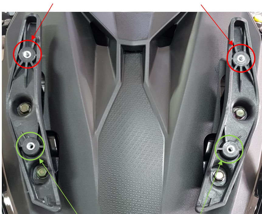
Location of the nylon beveled spacers 6×15